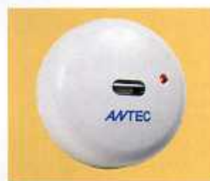
火災検出センサー-SKH047