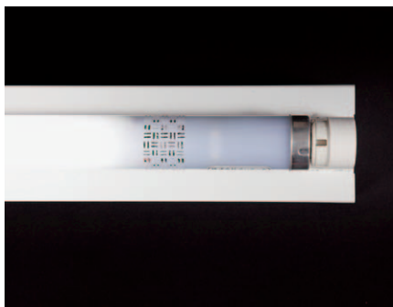
点灯時センサー部