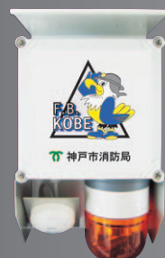
カメラ内蔵タイプ SKH072CA